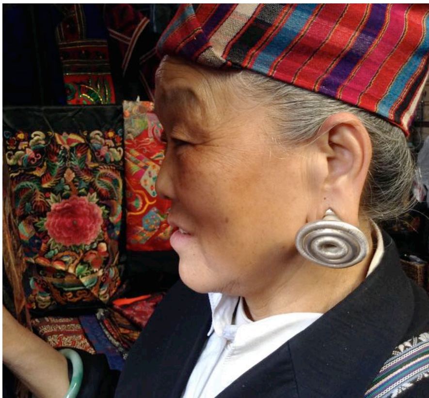
佩戴示意图