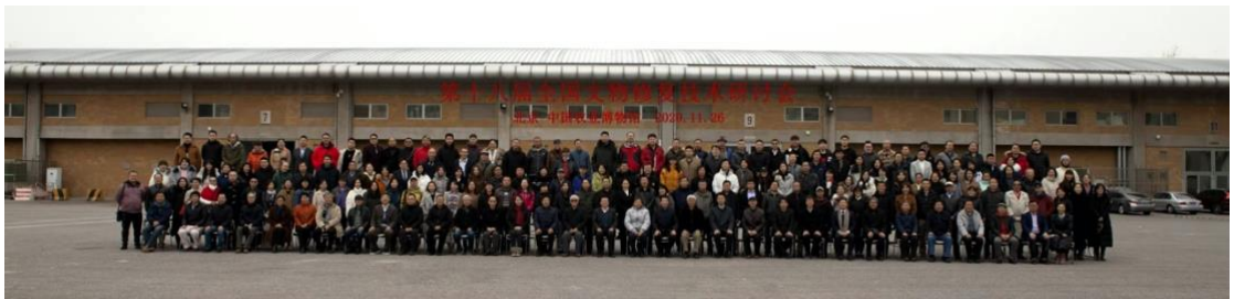
“第十八届全国文物修复技术研讨会” 与会人员合影

会议上各位专家学者对未来中国文物修复事业充满激情与希望，我馆也将努力肩负起继承和发展文物修复事业的使命，一起深入探索符合中国特色、中国风格、中国气派的文物修复体系。