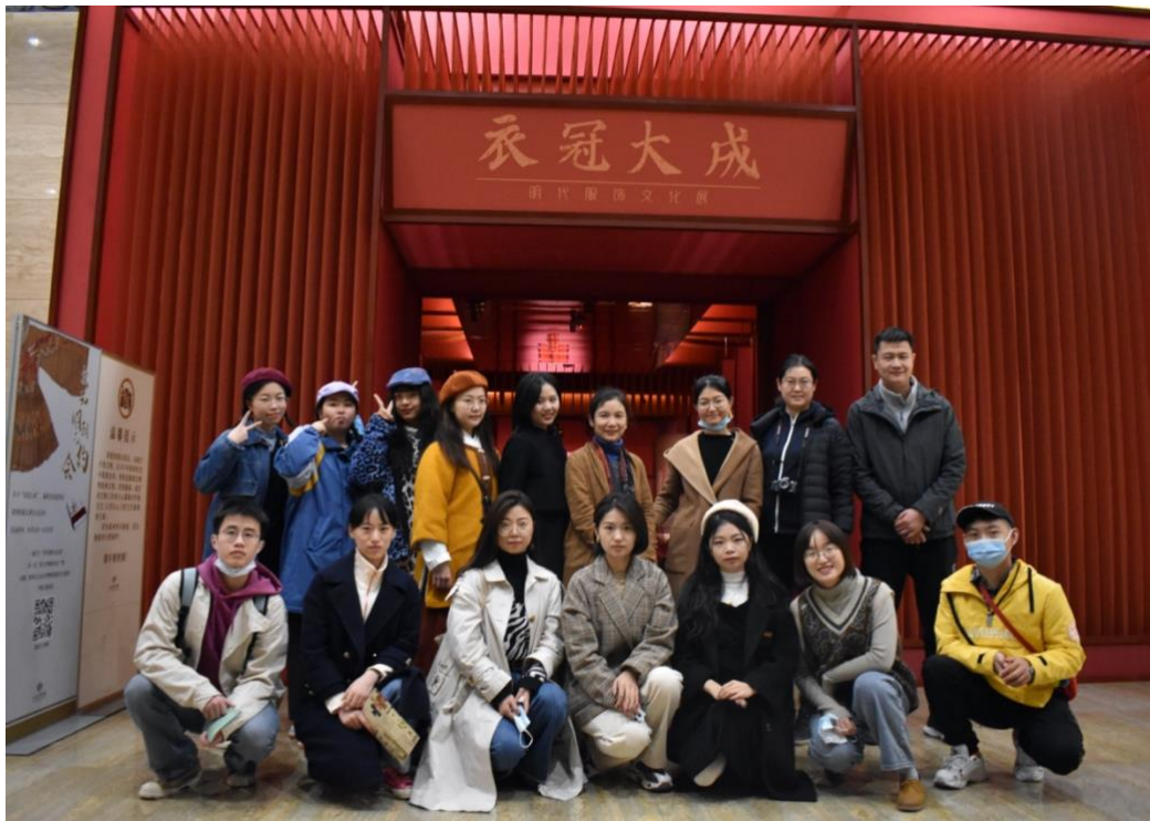
我馆师生在“衣冠大成——明代服饰文化展”前合影留念

配合了相关主题的光影、肌理与材质，使学生可以感受到脱离语境的古代服饰再次回归到官场、礼仪、日常三个历史语境中，并得以解读。