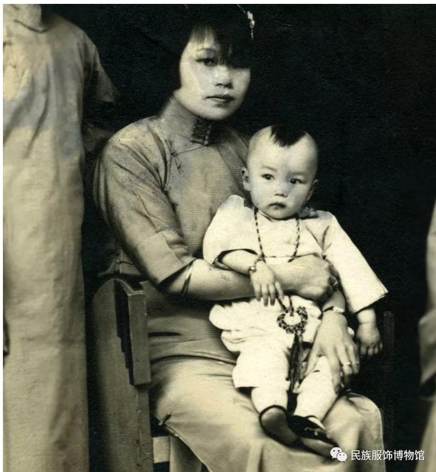
民国佩戴长命锁的孩童