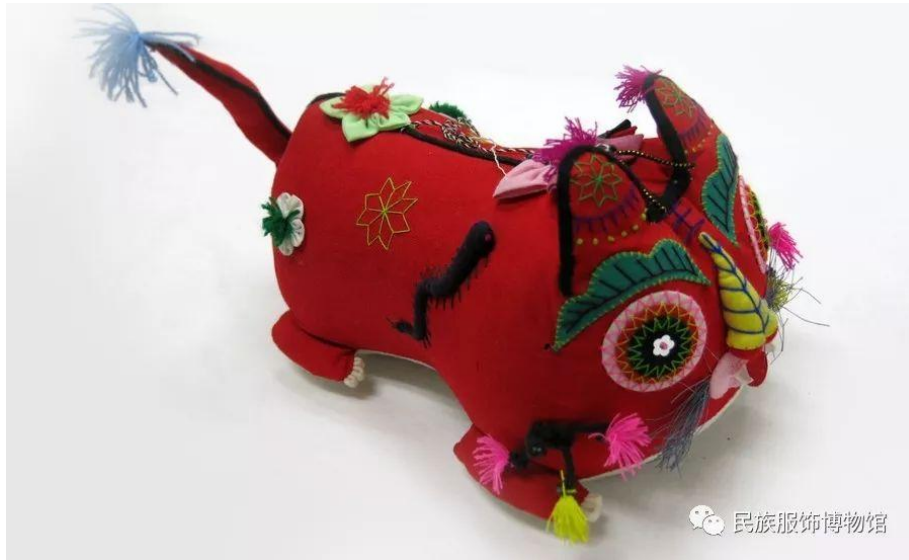
红布贴补绣虎形童枕正视图