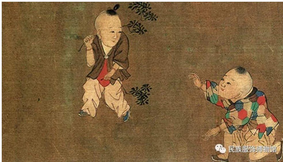
穿着百家衣的孩童