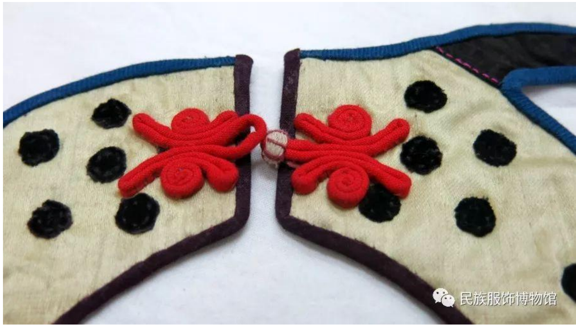
领口蝶形盘扣局部图