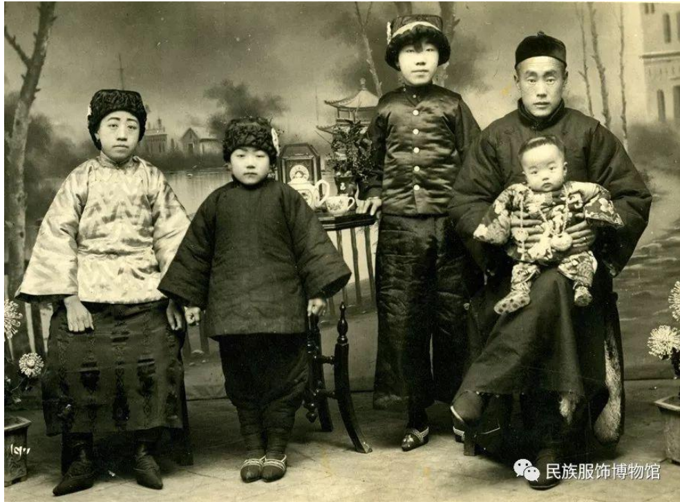
民国佩戴长命锁的孩童