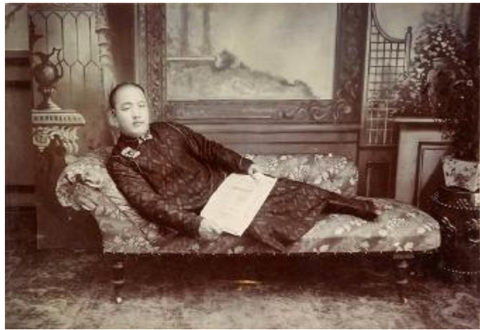
在寒冬腊月里锦裘摇椅，读书赏梅，好不惬意。