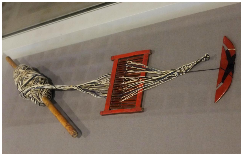
畬族织锦带织机配件

编织时，腰抵板凳一端，根据织造文字的需要，仿效织布的原理，一边用手挑起箱眼上的部分经纱，一边用手将放入纬线的线梭左右穿插。棉纱挑起的股数和序数需要随着笔画的伸展作出相应的增减和调整。通过对经线动态变化的掌控，有序操作，就可以织出一条带面结实、笔画规则的带子来。