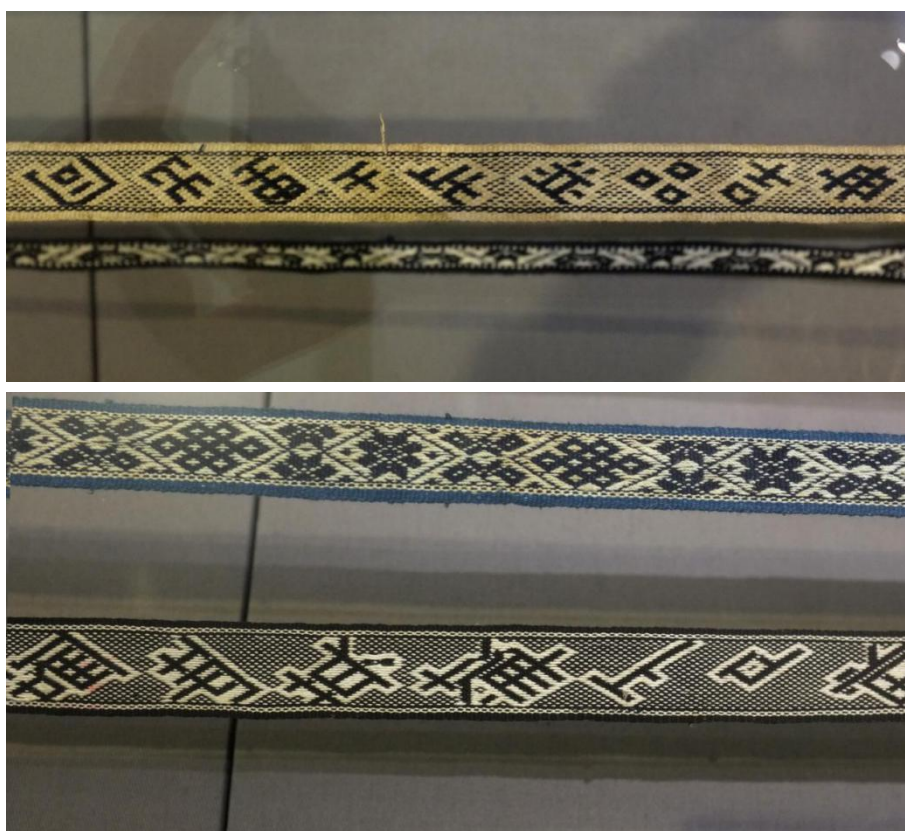
中国丝绸博物馆馆藏织有文字的织锦带

第三类文字织锦带，与符号类织锦带相比，出现时间较晚，是畚汉交流的成果，随着文化的互相交流发展，畚族人民也开始了汉文化的学习，并将汉字作为元素应用到织锦带的编织之中而产生了文字织锦带。织有“风调雨顺”“招财进宝”“三元及第”等吉祥语，还有解放后的“自力更生”“奋发图强”等汉字纹样，将家国命运和祈福之语织在带子上，雅俗共赏，满含意趣。