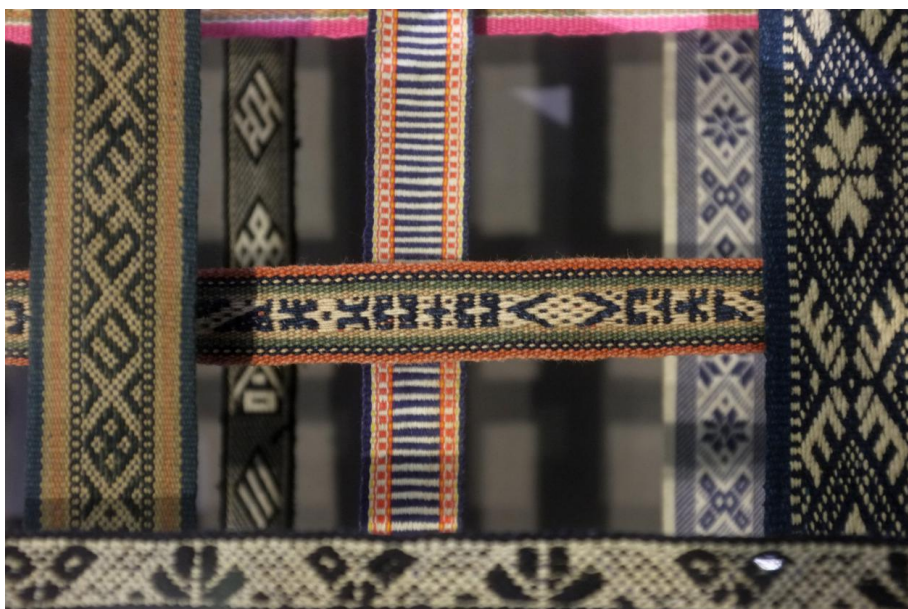
中国丝绸博物馆馆藏畲族织锦带

畲族传统《带子歌》这样唱道：“一条彩带斑又长，丝线拦边自己织，送给郎哥缚身上，看到带子看到娘。”这段民歌表明了织锦带作为畲族男女的定情信物，由姑娘亲手编织，被赋予美好寓意，是具有驱邪庇佑祝福的吉祥物，这也是彩带的重要功用。