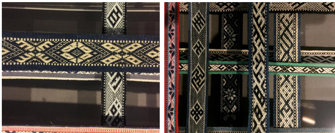
中国丝绸博物馆馆藏畬族织锦带

相比其它民族的编织工艺, 畬族这种把文字运用于织锦带中的传统工艺是不多见的, 其特殊的“意符文字”充满神秘色彩, 令笔者产生了浓厚的兴趣。