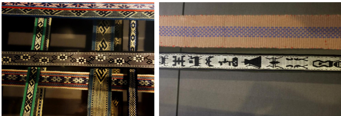
中国丝绸博物馆馆藏图案类织锦带