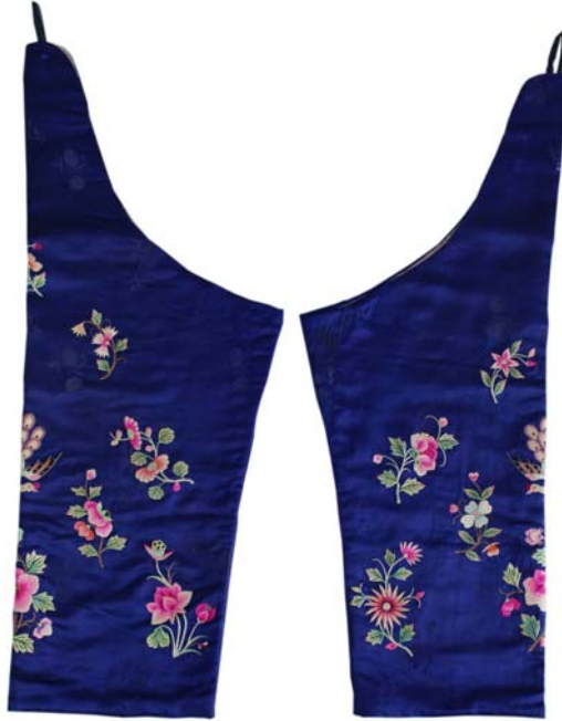
MFB001912 蓝色提花缎绣花蝶凤夹套裤

裤在古代称“袴”，《说文》：“袴，胫衣也。”清代文学家段玉裁在《说文解字注》中注解：“今所谓套袴也。左右各一，分衣两胫”。《清稗类钞》：“套裤，胫衣也，即古之所谓袴也。其形上口尖，下口平，或棉或夹或单，而沍寒之地，或且以皮为之。其质则为缎为绸为纱为呢，加于棉裤、夹裤、单裤之上，函于外而重沓也。大率为男子所用，若在妇女，则惟旗人及江苏镇江以北者始着之。”