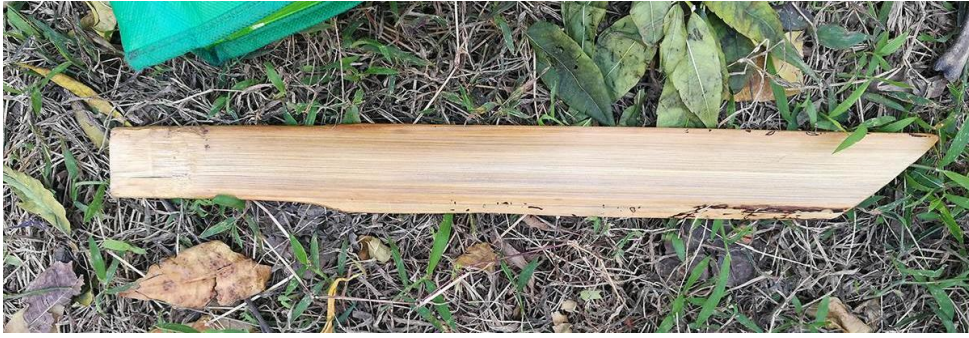
打纬的工具——打纬刀