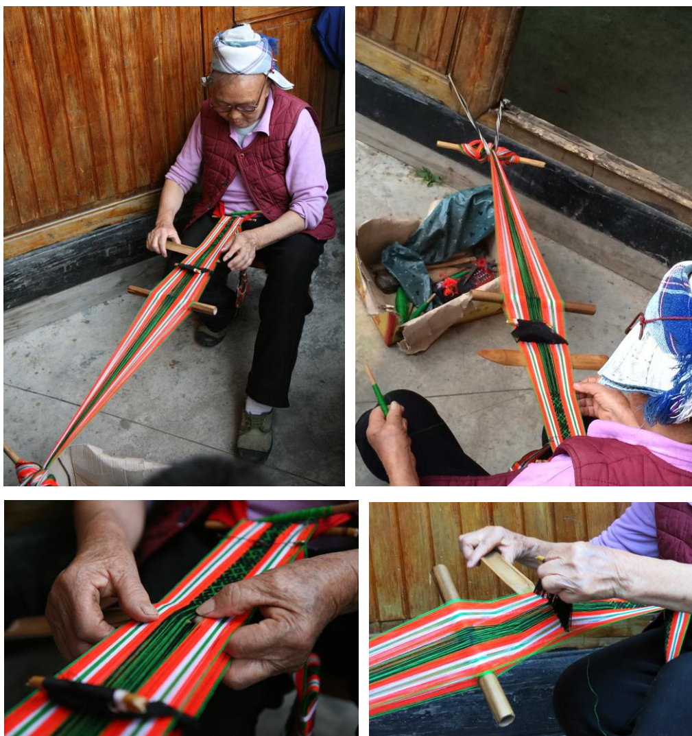
贵州麻塘仡 革家腰机织带

文中介绍的腰机织带在哈尼族以外的其他少数民族中也有流传，具体的操作过程略有差异，但织造原理大致相同。