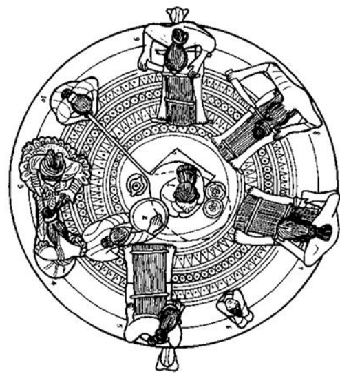
圖二 紡織貯貝器 紡織貯貝器頂視（右）