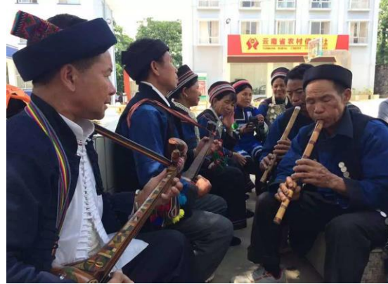
哈尼族歌手用于三弦系带上的 palhhaq