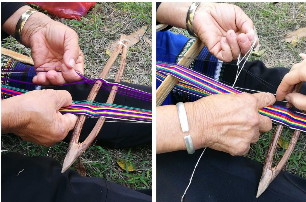
分经线，准备做提综杆

腿呈 90 度直立，双脚蹬住圆木棍（卷经轴）两端，经线另一头的竹片（卷布轴）则绑在腰间的带子上，将经线撑平。双手手指于二分叉木棍（分经棍）处，按照分出的两层经面对经线做上下位置的调换（即原来位于下层的经线挑到上层，原来上层的经线压到下层）。调换完成后，选取双股白色棉线由新的梭口中穿过，每拨过一根上层经线则将白色棉线挑出兜住经线，并将白色棉线绕到手指上（距离经面约 6cm 左右）捏住，依次将所有上层经线都挑完。最后将手指头上的白色棉线统一都固定在一根短小的木棍上，白色棉线制作的提综杆/线综即完成。此道提综杆/线综与二分叉木棍（分经棍）形成了交错的两道投纬口，是织造之前必须完成的工作。