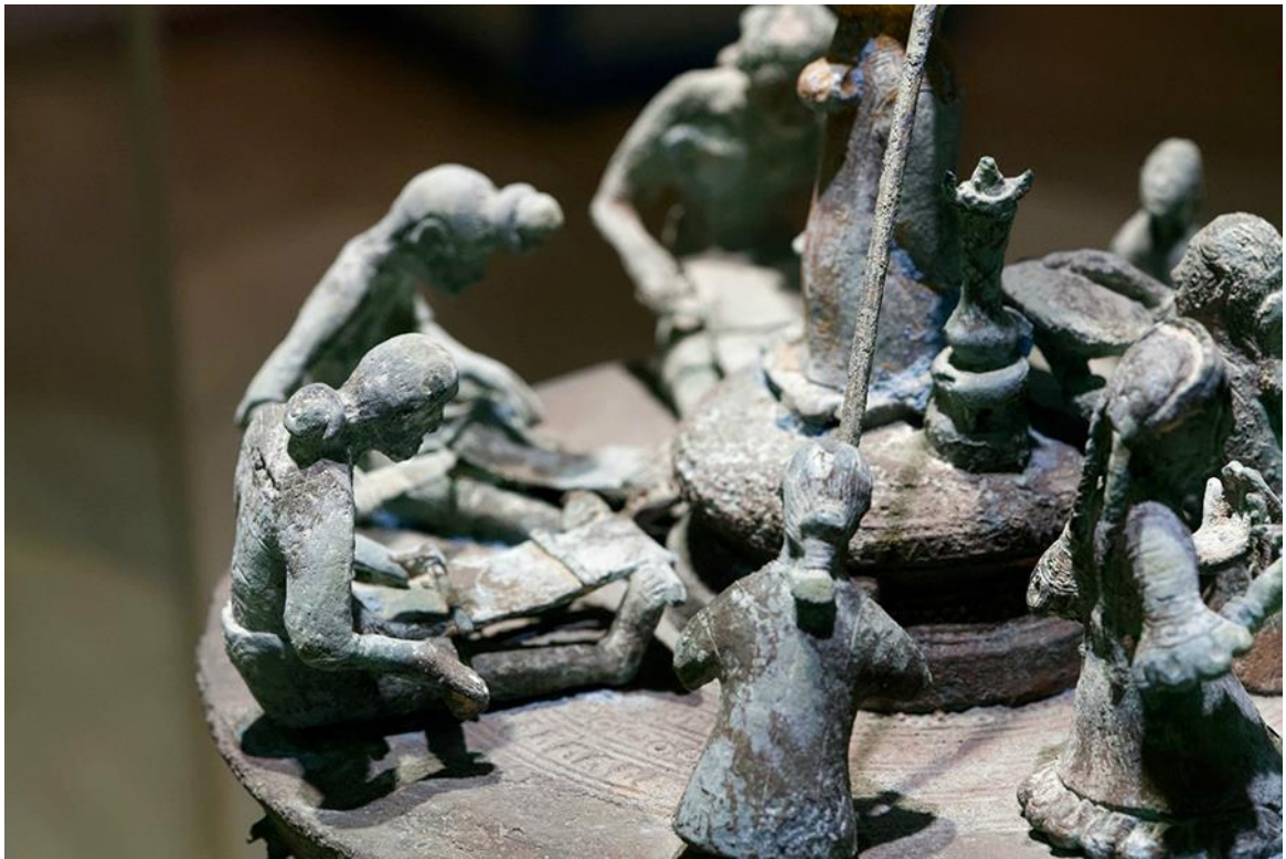
纺织场面铜贮贝器