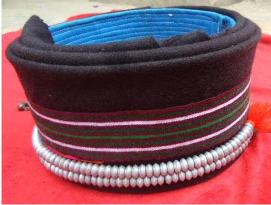
哈尼族女包头上的织带

（Palhhaq duldeil）等等地方，在传统婚丧中亦有使用，在新娘出嫁时候，用于新娘所戴篾帽上的帽带以及嫁妆中棉被的捆绑，在丧礼中，也围于逝者殓服腰部最外层。随着经济社会不断发展，这一项古老的技艺也逐渐萎缩，目前主要都是年龄较大的妇女才会去编织了。以此文记之，提供给爱好者，希望此传统技艺能有所传承。