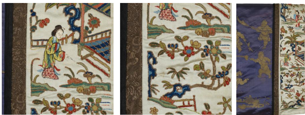
袖口刺绣工艺局部图

金箔包裹于丝线外形成金线，再用金线织造锦缎，这种工艺称为“织金”，宋元以来较为流行，因其制作成本奢贵，多用来制作贵族服饰。馆藏这件女褂衣身面料中的百子嬉戏纹就是用金线间金黄色丝线织就的。打籽绣是一种由绣地起针之后，绣线在针尖上绕圈，用手指按住线圈，然后落针拉紧绣线固定，形成环状小结，以籽状小点组构纹样的绣法，其绣面坚固耐磨，立体感强，且富于肌理感。盘金绣是将金线盘组成图形，再用绣线将其钉缝固定于面料上的针法，其绣品凹凸有致，璀璨耀眼，富丽华贵，亦常见于宫廷官宦之家。馆藏这件女褂白色袖口上的仕女风景装饰纹样便是以打籽绣工艺为主、间饰盘金绣、平绣、网绣工艺完成的。其中亭台楼阁、花卉绿植等风景纹用打籽绣填充纹样内里、盘金绣盘绕外轮廓完成，仕女纹采用平绣、网绣等技法完成。